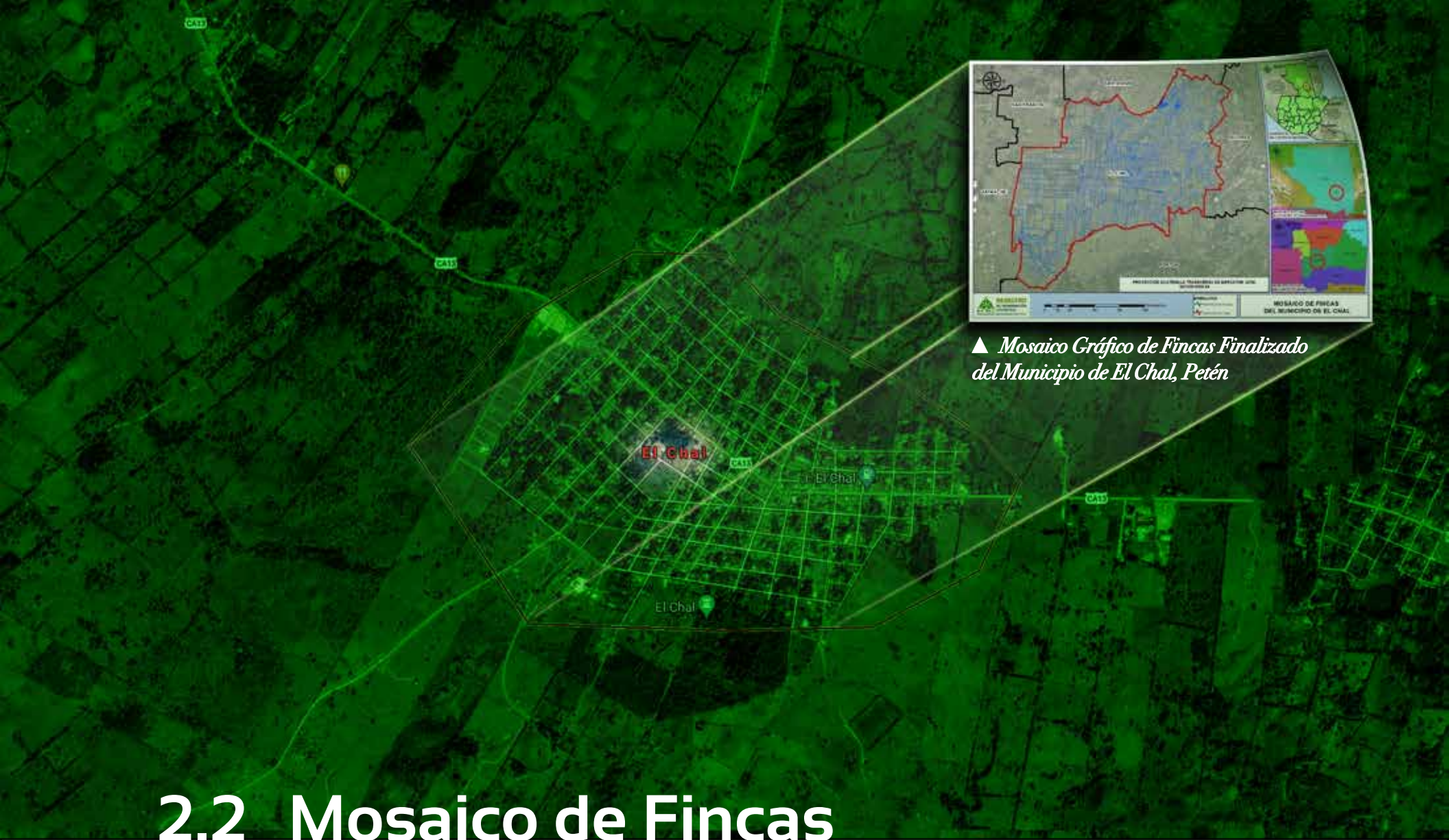
▲ Mosaico Gráfico de Fincas Finalizado del Municipio de El Chal, Petén