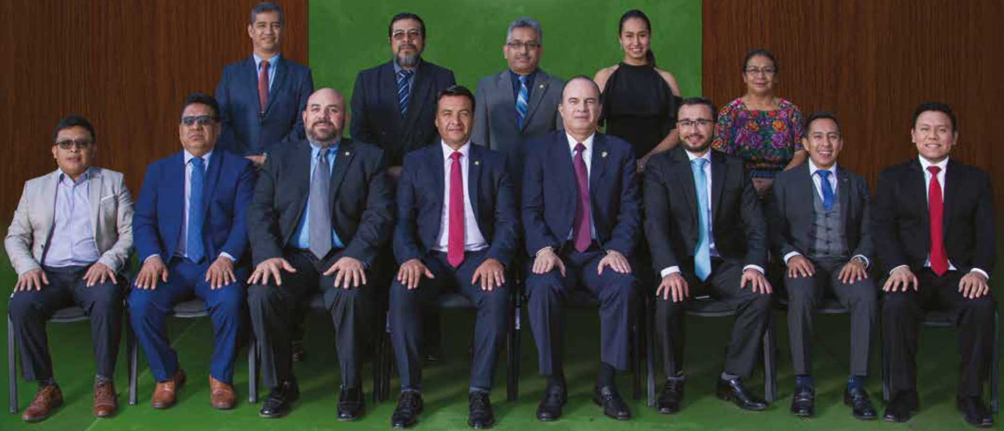
Consejo Directivo 2019